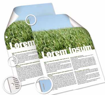
Graffatura e perforazione dei documenti

MP C2050 e MP C2550 presentano un esclusivo finisher interno da 500 fogli per la perforatura e la graffatura dei documenti. Questa opzione di finitura, sommata all'eccellente qualità di stampa ed alla gestione versatile dei supporti, permette di produrre documenti dall'aspetto professionale limitando il ricorso a fornitori esterni.