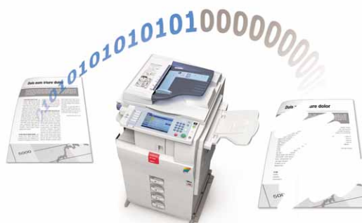
Sovrascrittura dei dati sul disco fisso

Le funzionalità di autenticazione e codifica dei dati proteggono le informazioni riservate. MP C2050 e MP C2550 sono compatibili con sistemi di sicurezza opzionali che permettono la sovrascrittura dei dati sul disco fisso, la protezione dei dati contro la copiatura, l'autenticazione tramite card e l'autorizzazione alla stampa.