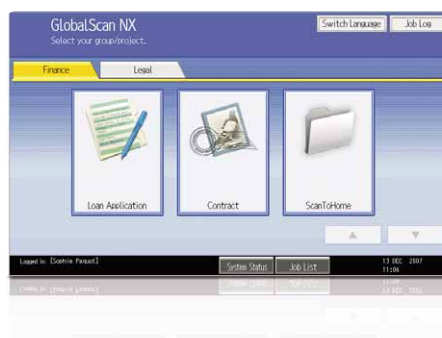
Interfaccia grafica (GUI) intuitiva

La soluzione intuitiva GlobalScan NX razionalizza il flusso di lavoro grazie a funzionalità flessibili di scansione e distribuzione. L'interfaccia grafica utente (GUI), molto facile da utilizzare, consente di memorizzare delle icone con impostazioni personalizzate relative al formato ed al flusso dei documenti. Dal pannello di controllo di MP C2050 e MP C2550 è possibile eseguire direttamente scansioni in un solo passaggio.